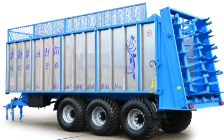
Полуприцепы ПСП «Гигант»