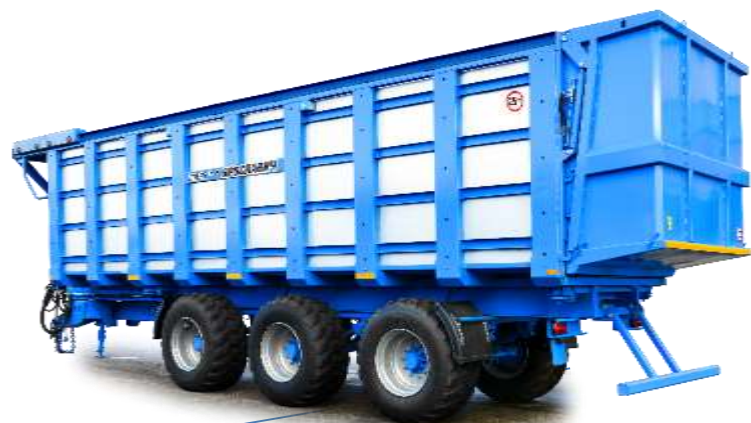
Полуприцепы тяжелые ПСП