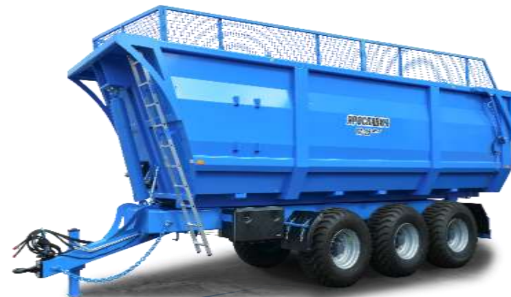
Полуприцепы серии ПС